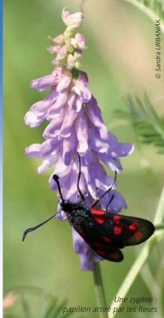
Une zygène : papillon attiré par les fleurs