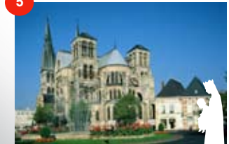
Eglise Notre-Dame-en-Vaux CHALONS-EN-CHAMPAGNE