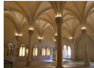
Ancienne Abbaye royale Saint-Remi REIMS