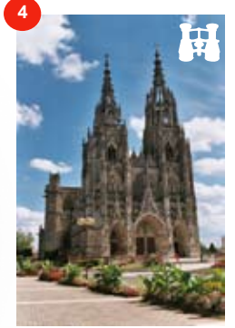
Basilique Notre-Dame L'EPINE