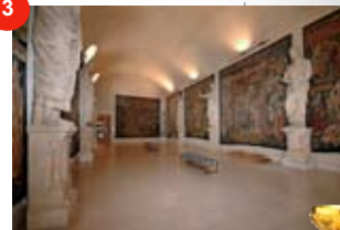
Palais du Tau REIMS